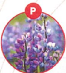
P LUPINEN UND DARAUS GEWONNENE ERZEUGNISSE