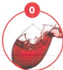
O SCHWefeldioxid UND SULFITE