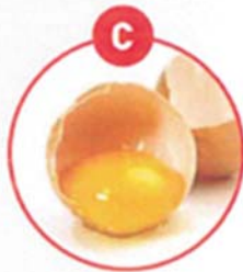
C EIER VON GEFLÜGEL UND DARAUS GEWONNENE ERZEUGNISSE