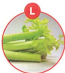
L SELLERIE UND DARAUS GEWONNENE ERZEUGNISSE