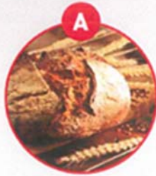
A GLUTENHALTIGES GETREIDE UND DARAUS GEWONNENE ERZEUGNISSE