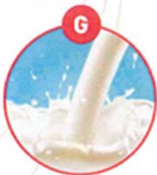
G MILCH VON SÄUGETIEREN UND MILCHER- ZEUGNISSE (INKLUSIVE LAKTOSE)