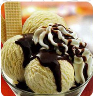
Coupe Dänemark Drei Kugeln Bourbon-Vanilleeis mit Sahne und reichlich Schokoladensauce