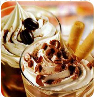
Eisschokolade/Eiskaffee Köstliches Schokoladegetränk oder aromatischer Kafee mit Bourbon-Vanilleis und einer Sahnehaube.