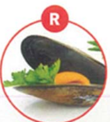
R WEICHTIERE WIE SCHNECKEN, MUSCHELN, TINTENFISCHE UND DARAUS GEWONNENE ERZEUGNISSE