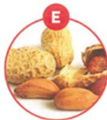
E ERDNÜSSE UND DARAUS GEWONNENE ERZEUGNISSE