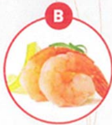
B KREBSTIERE UND DARAUS GEWONNENE ERZEUGNISSE