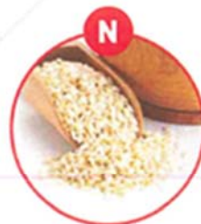
N SESAMSAMEN UND DARAUS GEWONNENE ERZEUGNISSE