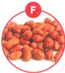
F SOJABOHNEN UND DARAUS GEWONNENE ERZEUGNISSE