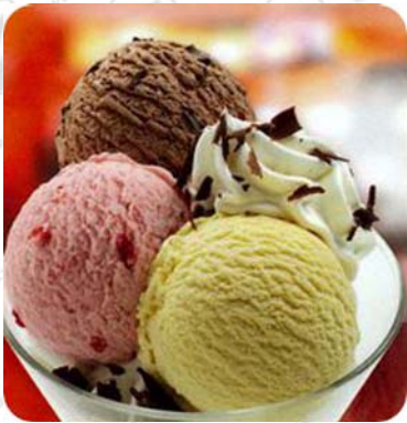
Gemischtes Eis mit drei Kugeln Eis nach Wahl, Garniert mit Sahne