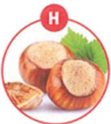
H SCHALENFRÜCHTE UND DARAUS GEWONNENE ERZEUGNISSE