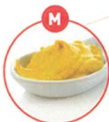
M SENF UND DARAUS GEWONNENE ERZEUGNISSE