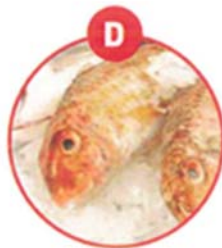
D FISCH UND DARAUS GEWONNENE ERZEUGNISSE (AUSSER FISCHGELATINE)